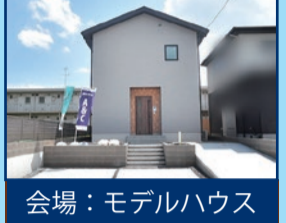
会場：モデルハウス